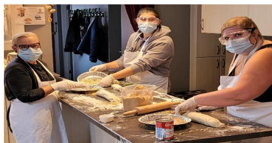
NOËL22 Boîte de desserts